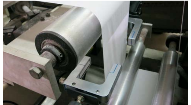
Ultrasonik Uzun Bantlı Sensörler DU-2N kâğıt mendil makinesi üzerinde kullanılmaktadır.