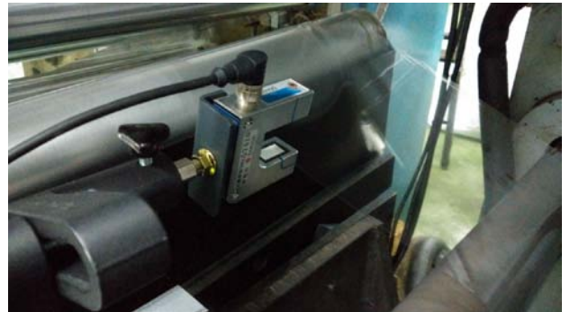
Ultrasonik Uzun Bantlı Sensör DU-1N sarma makinesi üzerinde kullanılmaktadır.