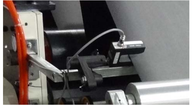
Kızılötesi Sensör DS-7 siyah kumaşlar üzerinde kullanılmaktadır.