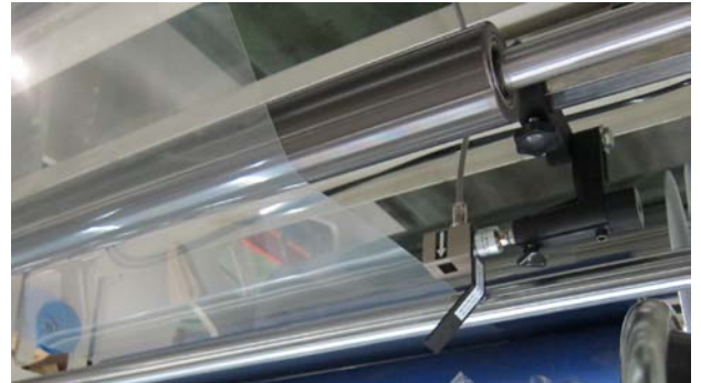
Fotoelektrik Sensör DT-6 şeffaf film üzerinde kullanılmaktadır.