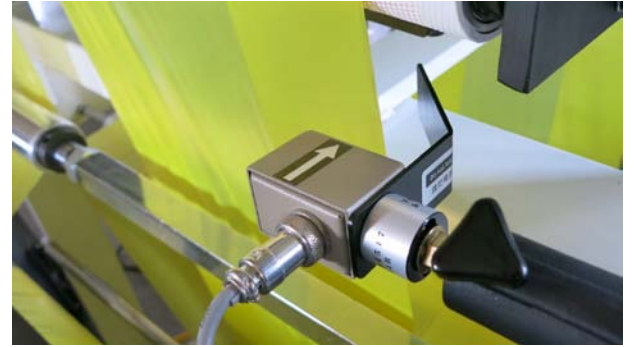
Fotoelektrik Sensör DT-6 çanta yapım makinesi üzerinde kullanılmaktadır.