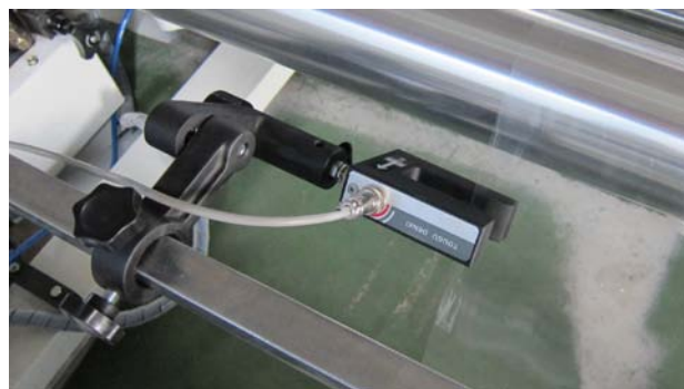
Инфракрасный Сенсор DS-7 применяется для прозрачной пленки