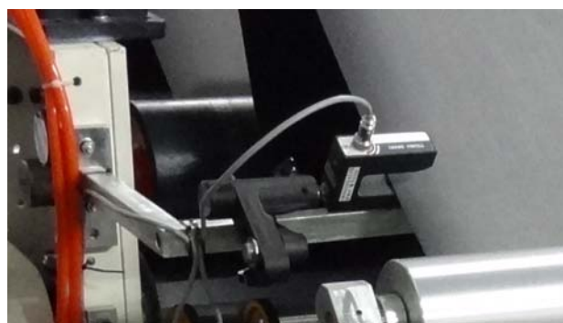
Инфракрасный Сенсор DS-7 применяется для черных тканей